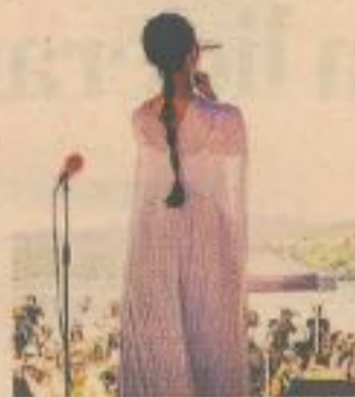
El Festival Sinsal Son Estrella se celebra en Rías Baixas, en Galicia.

FESTIVAL Sinsal Son Estrella Galicia 2024 se celebrará en las Islas de San Simón y de San Antón, en las Rías Baixas (Galicia), del 26 al 28 de julio, en un archipiélago declarado Bien de Interés Cultural. El festival, cuyo cartel es secreto hasta que el público desembarca, contará con más de 20 bandas y solistas de diversos estilos y orígenes, y a él solo accederán 800 personas cada día.