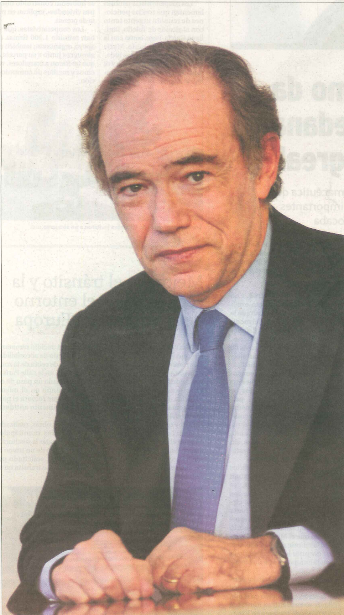
Marañón considera necesario llegar a los 20 millones de euros para afrontar con solvencia el programa del IV centenario.

«'El Greco 2014' es el proyecto más ilusionante que Toledo tiene por delante»