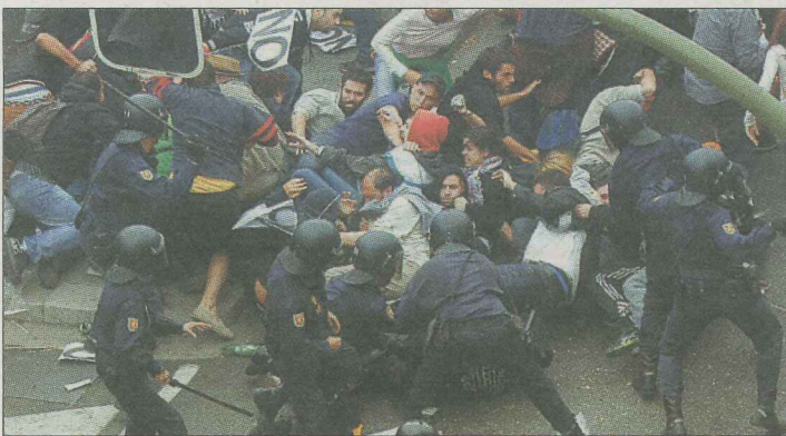
La Policía cargó contra los manifestantes que rodearon el Congreso.